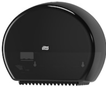
Tork Spender Mini Jumbo Toipa Elev sw T2 555008