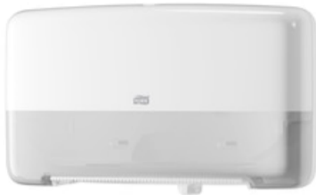
Tork Doppelpf Mini Jumbo Toipa El we T2 555500