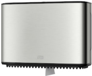
Tork Spender Mini Jumbo Toipa Stahl T2 460006