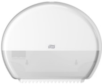
Tork Spender Mini Jumbo Toipa Elev we T2 555000